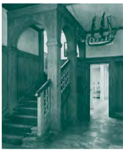
HALLE MIT BLICK IN DEN »KLEINEN INNENHOF«, 1919

Geisteswissenschaftliche Zentren Berlin Schützenstraße 18 | 10117 Berlin FON +49 (0) 30-20 192 130 FAX +49 (0) 30-20 192 120 www.gwz-berlin.de