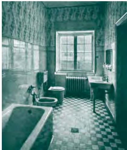
BAD DER DAME, 1919

COVER Der Mittelhof , Blick von der Rebhiese durch die Kiefern auf die Veranda und den Wirtschaftsfügel, 1919