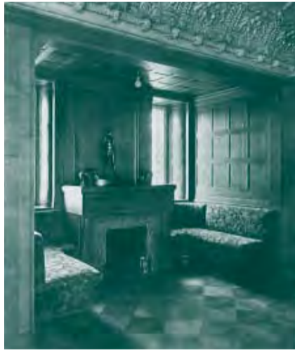
KAMINECKE IM ESSZIMMER, 1919